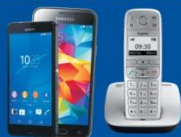
Handy und Telefon