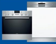
Kochen und Spülen