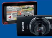
Foto und Navigation