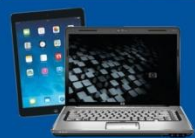
PC, Notebooks und Tablet-PCs