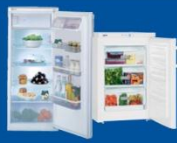
Kühlen und Gefrieren