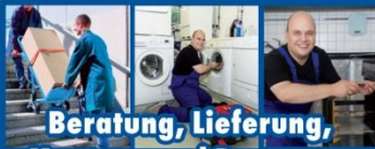
Beratung, Lieferung, Montage und Reparatur