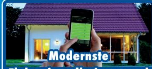
Moderne Elektroinstallationen und Smart-Home-Technologie