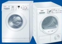
Waschen und Trocknen